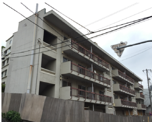
現在の外観（南西側）