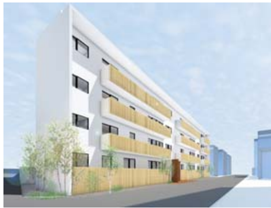
リファイニング後の外観イメージ（南西側）