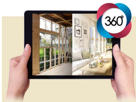
タブレット端末利用のイメージ