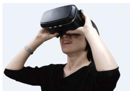
VR（仮想現実）利用のイメージ

室内の360°写真と、お客様の要望を反映した改装イメージを合成し、完成前後の様子を2画面同時に表示できます。また、複数の改修イメージのCGを並べることも可能です。