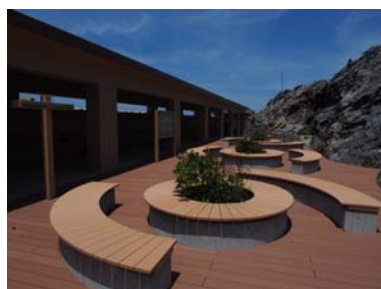
ベンチ・デッキ (神津島)