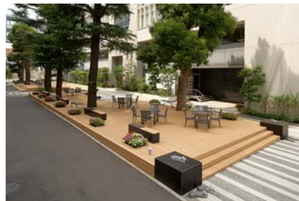
デッキ (昭和女子大学)