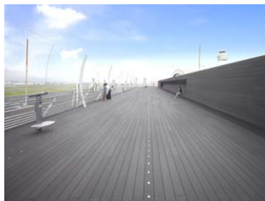
展望デッキ (羽田空港第1ターミナル)