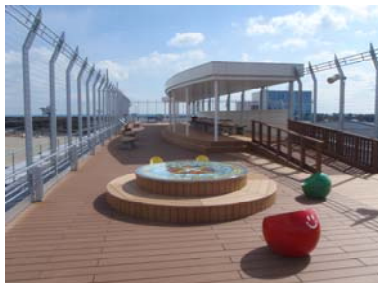
展望デッキ (仙台空港)