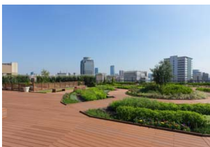
屋上デッキ (アトレ恵比寿)