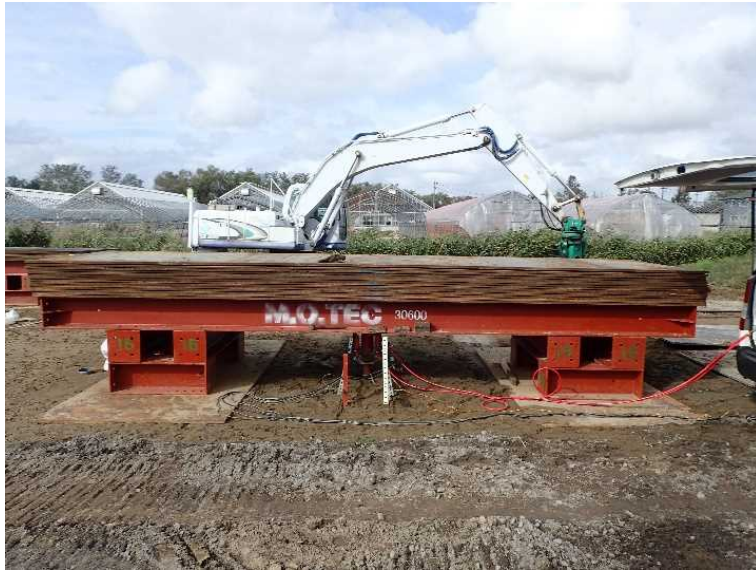
写真-1 現場実証試験の状況