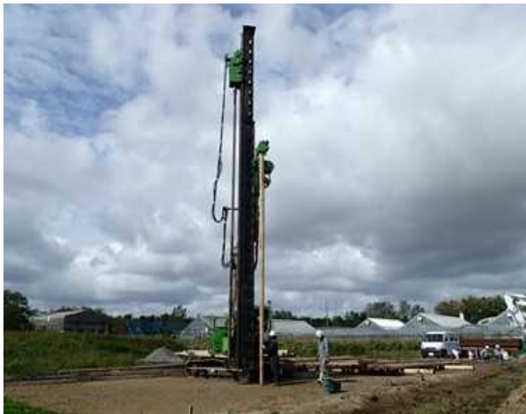
写真-2 大潟村(八郎潟干拓地)における秋田県立大学敷地内での実証実験の様子