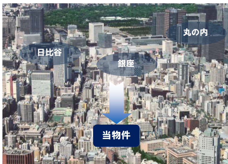
《銀座を徒歩圏に立地する「アネシア築地ステーションレジデンス」(イメージ)》

「アネシア築地ステーションレジデンス」はトヨタホームの分譲マンション「アネシア」シリーズを今後、首都圏で展開していく上で、フラッグシップとなるよう立地、デザイン、居住性にこだわりました。