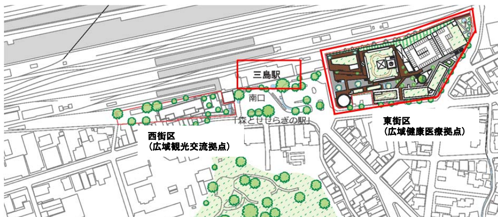
三島駅前の位置関係