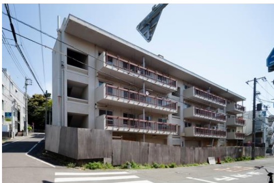
リファイニング前