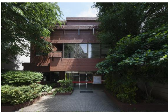
リファイニング前

※ 2018 年度グッドデザイン賞を受賞（ミサワホーム、青木茂建築工房による共同受賞）