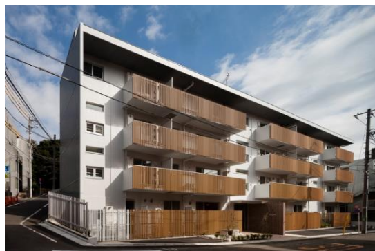
リファイニング後