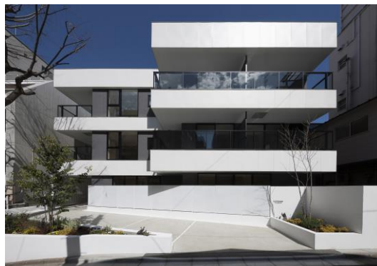
リファイニング後