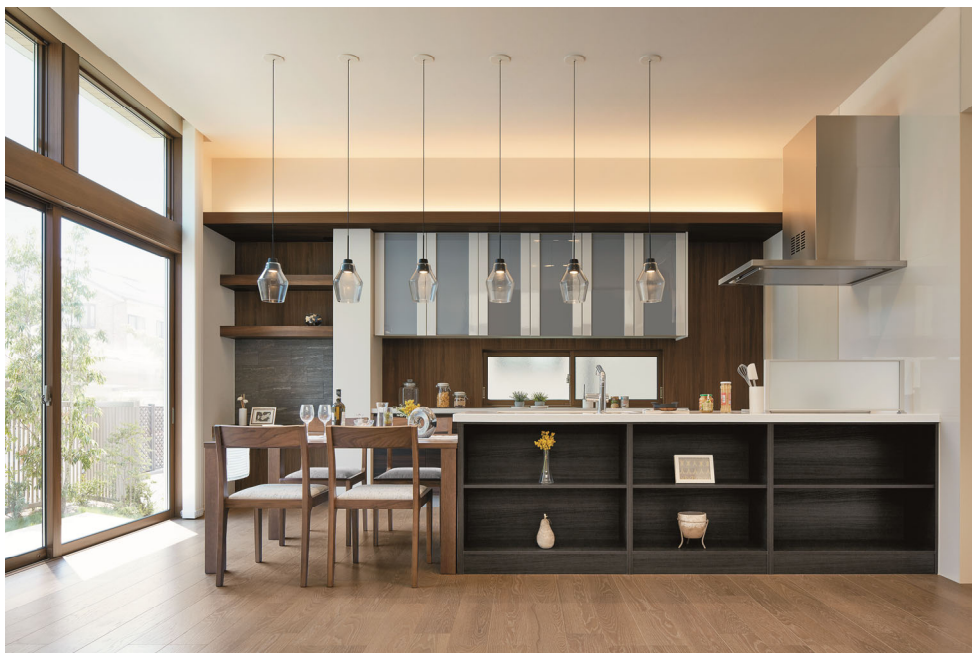
南面のハイサッシから光を取り込み明るいダイニングキッチン

※内観イメージであり、実際の仕様とは異なります。また、家具等のインテリアは価格に含まれません。