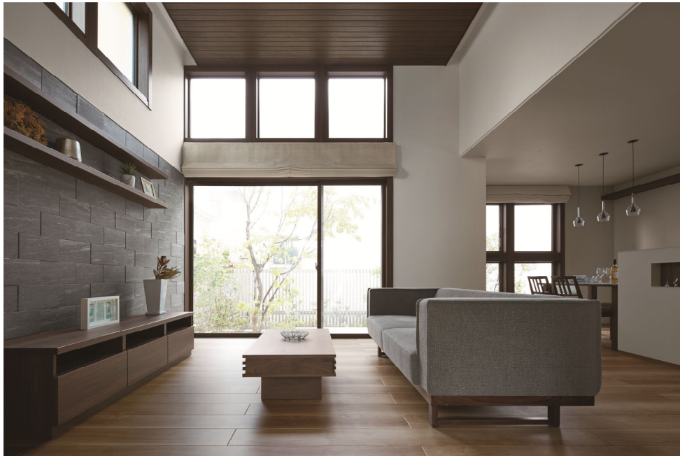
約 3m の高天井によりゆとりある大空間リビング