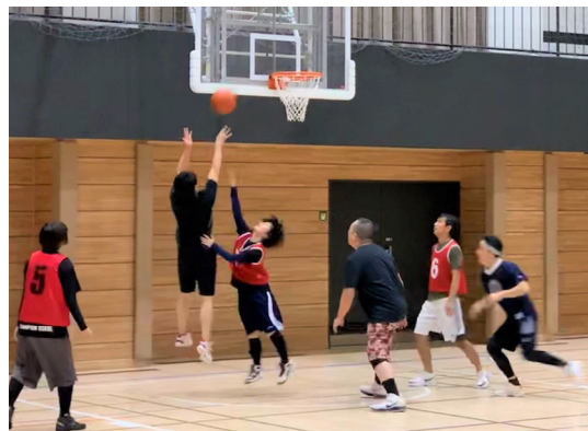
バスケットボールの様子