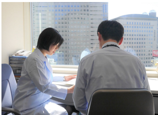
健康診断受診後の産業医フォローの様子