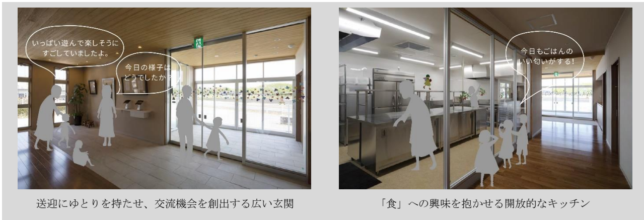
送迎にゆとりを持たせ、交流機会を創出する広い玄関