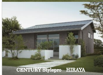
CENTURY Stylepro HIRAYA