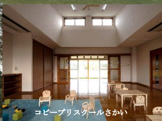
コピープリスクールさかい