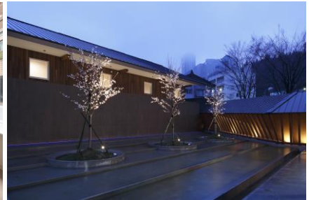
ホテル増築（四季 クワトロ） ※ 2013年度グッドデザイン賞受賞