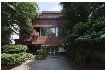
リファイニング前