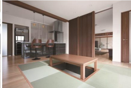
戸建（モダン・掘りごたつ）