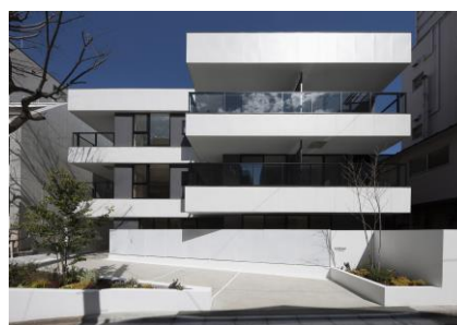
リファイニング後（ASPRIME 千代田富士見） ※ 2018年度グッドデザイン賞受賞

こうしたニーズはエリアによって大きく異なっており、とりわけ首都圏、関西、中部などの都市部においては戸建リフォームに加え、非住宅の大規模リフォームや不動産との一体提案など、ニーズが多様化しているため、より柔軟にスピーディーに対応できるよう、事業体制の強化を図ります。