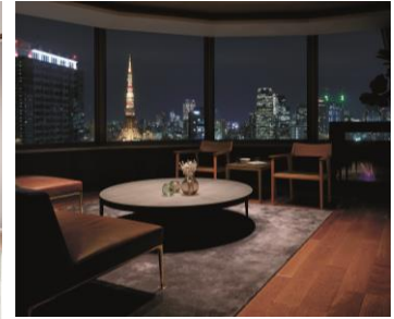
マンションリフォーム