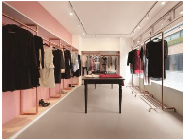
セレクトショップ改装