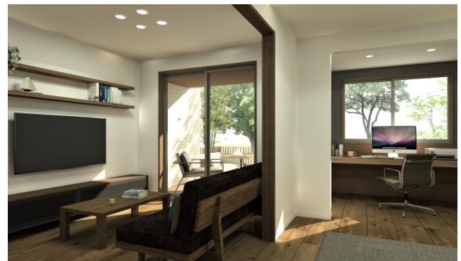
外観・内観イメージ