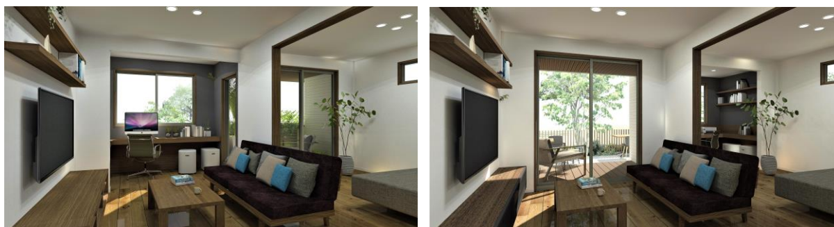
戸外に面した「スイッチとリチャージ」のイメージ

寝室やリビングとつながり戸外に面したワークスペースは、家事や子どもの勉強を見ながら仕事をする“ながらワーク”に適した「スイッチ」タイプを提案。1 階ならガーデン、2 階ならバルコニーに隣接しているため、外に出ればリラックスしながらアイデア出しや頭の整理が可能な「リチャージ」スペースとしての活用もできます。また、室内干し用のサンルームや趣味を楽しむコーナー、仕事が終わればリビングと一体で居室を広く活用するなど、入居者の暮らしにあわせた多目的な活用も可能です。