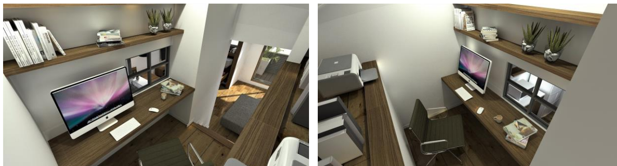
蔵上部の「フォーカス」タイプのイメージ

「蔵」上部のスキップフロアを活用したワークスペースは、資料作成や Web 会議など、集中して仕事に取り組める「フォーカス」タイプを提案。LDK や寝室から 0.5 階上がっているため、仕事とプライベートの ON/OFF の切り替え効果に加え、お子さまの学習スペースやこもり部屋としての活用も可能です。