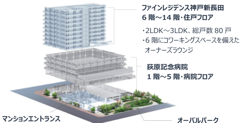
複合施設「ASMACI 神戸新長田」イメージ