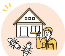
シロアリ予防工事