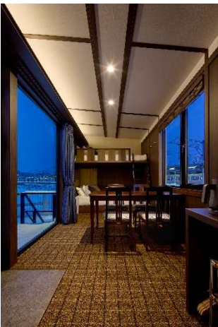
窓から函館駅ホームの車両を眺める バンクベッドを備えた重厚感のあるリビングルーム

室内は、異国情緒あふれる函館の街並みと呼応する「函館クラシックモダン」をテーマに、重厚感のあるダークブラウンの木目調を基調とし、落ち着いたある豪華寝台列車を彷彿とさせる空間を演出。邸宅のような心地よさを追求したオリジナル家具や、家族やグループでくつろげるバンクベッドを備えています。さらに、専用タブレット端末を用いた無人チェックイン・システムを採用し、受付待ちや対面による煩わしさを解消。ストレスフリーな宿泊体験を提供します。