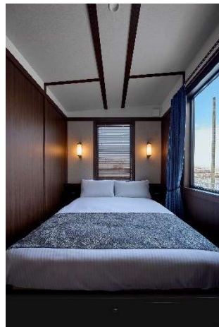
豪華寝台列車を思わせる ベッドルーム