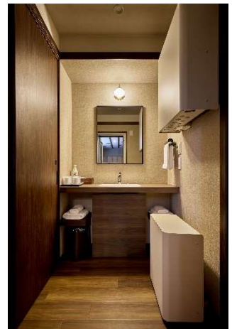
使いやすいシックな 洗面スペース