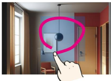
気になる箇所をフリーハンドで操作

生成された画像のなかで気になる箇所を囲うだけで、近い商材を画像検索できる機能を搭載しました。イメージの可視化から具体的な商材選定までをスムーズにつなげます。また、生成した画像は保存や共有が可能で、打ち合わせの記録としても活用できます。