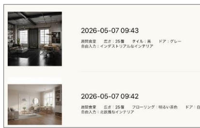
保存して打ち合わせの記録としても活用