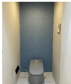
さまざまなパターンをイメージ