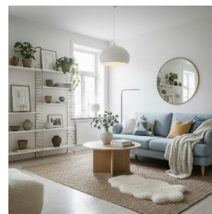
好みのインテリアのイメージを生成