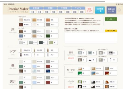
ボタン選択でプロンプトを設定

部屋の種類、広さ、床や壁の色などの要素をボタンで選択するだけで、AI への指示文（プロンプト）を自動的に作成。自由なテキスト入力も併用でき、特定の家具や「北欧風」といった抽象的なニュアンスも即座に画像へ反映します。