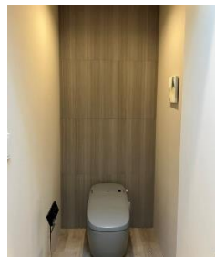
写真をアップロード

実際のお客さま宅の写真をアップロードし、その写真をもとにインテリアを変更したイメージを生成できます。これにより、設備交換だけでなく、空間全体の雰囲気がどのように変わるかをリアルに提示でき、お客さまのこだわりを反映させた多角的なライフスタイルの提案を後押しします。